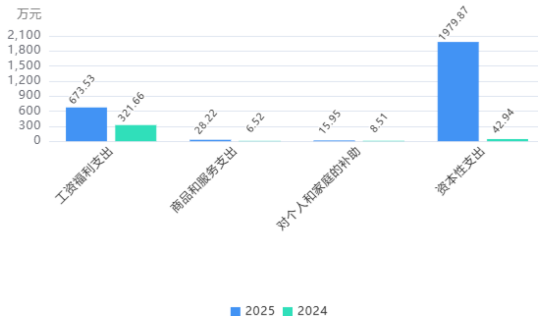
支出按部门预算支出经济分类对比图

2. 按照政府预算支出经济分类，本单位当年一般公共预算支出2,697.56万元，其中：